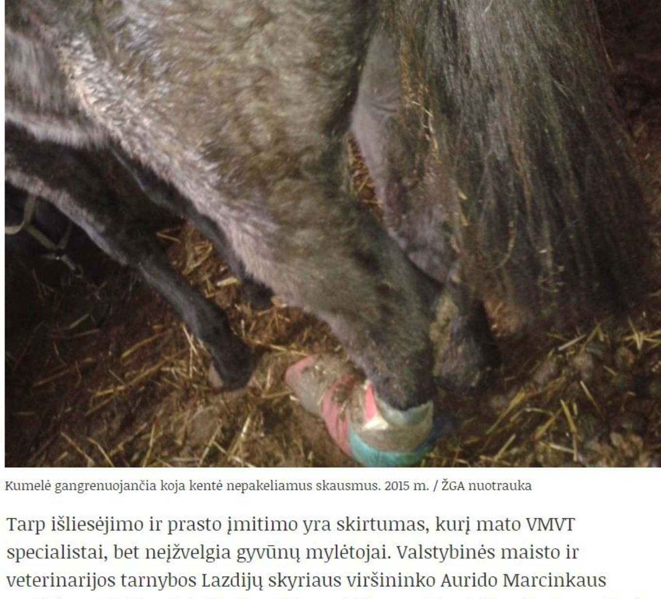
Kumelė gangrenuojančia koja kentė nepakeliamus skausmus. 2015 m.